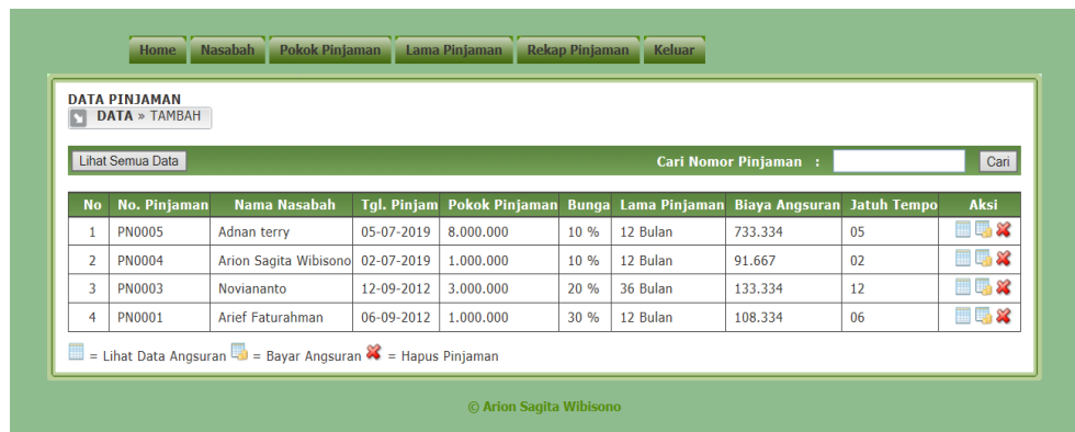
Gambar 6. Form Rekap Pinjaman

Tampilan ini digunakan untuk membayarkan angsuran pokok dan untuk mengetahui informasi secara lengkap nasabah perihal jatuh tempo, sisa angsuran,