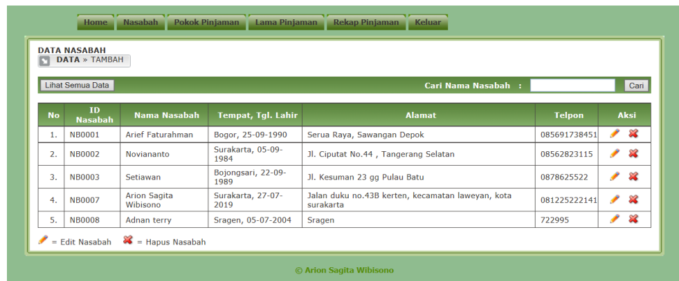
Gambar 3. Form Nasabah

Tampilan form Nasabah ini menampilkan daftar nama-nama nasabah yang mengajukan pinjaman.