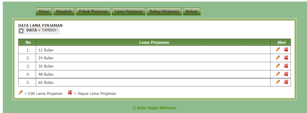
Gambar 5. Form Lama Pinjaman

Tampilan form lama pinjaman ini menampilkan tenggat waktu yang bisa nasabah pilih dalam melunasi angsurannya.