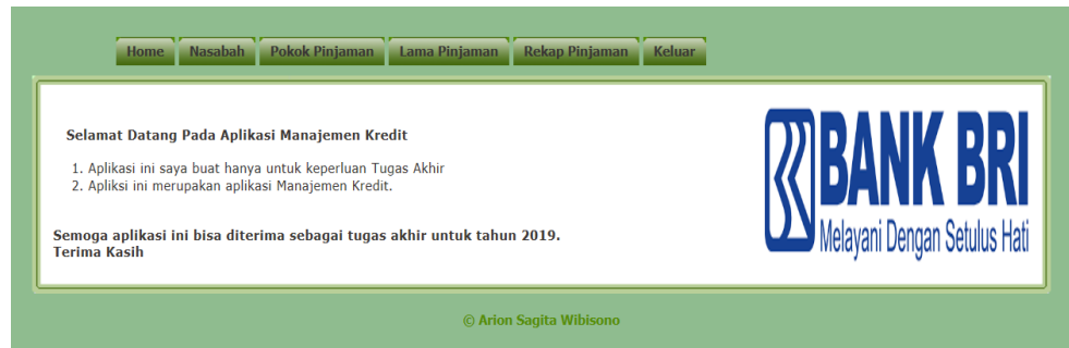
Gambar 2. Form Home

Tampilan home merupakan tampilan awal setelah from login, disini menampilkan banyak berbagai pilihan menu yang akan digunakan.